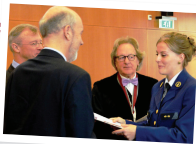
Uitreiking certificaten door de ambassadeurs.